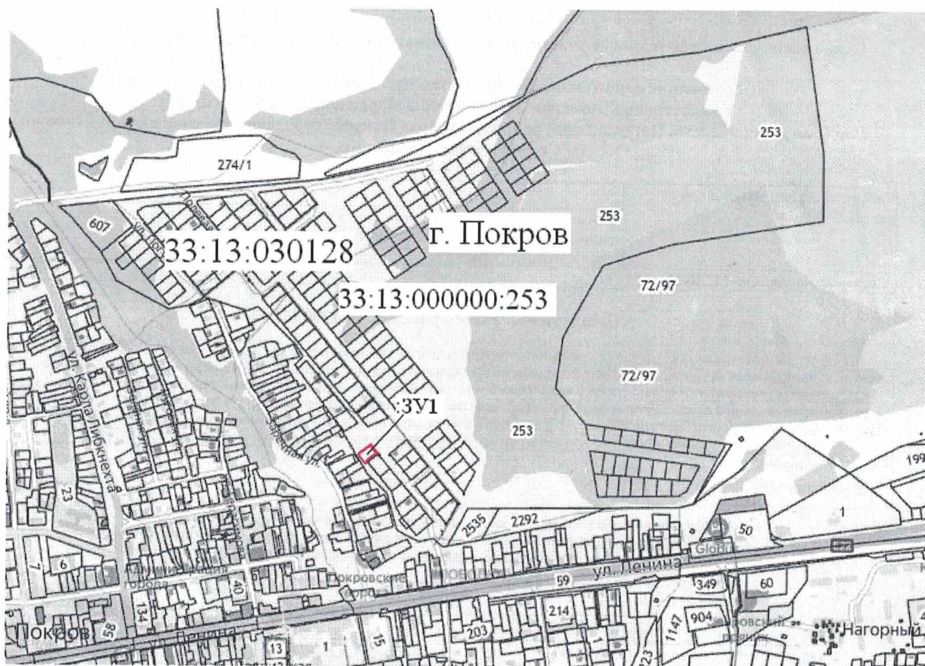
План (чертеж, схема) объектов недвижимости, расположенных в кадастровом квартале